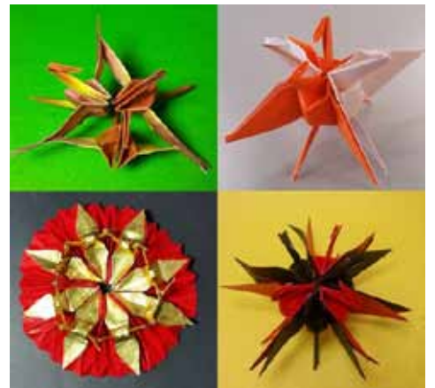
全て一枚の紙からできている連鶴