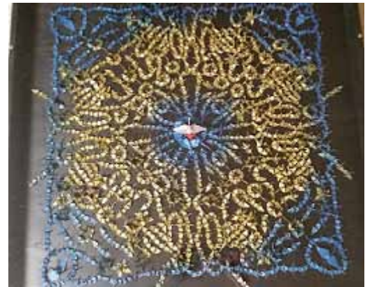
千羽鶴連鶴：曼荼羅 2