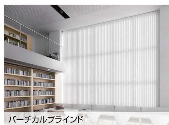
バーチカルブラインド V-1202 ライトグレー