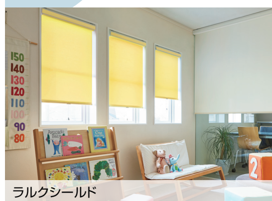
ラルクシールド RS-8350 イエロー