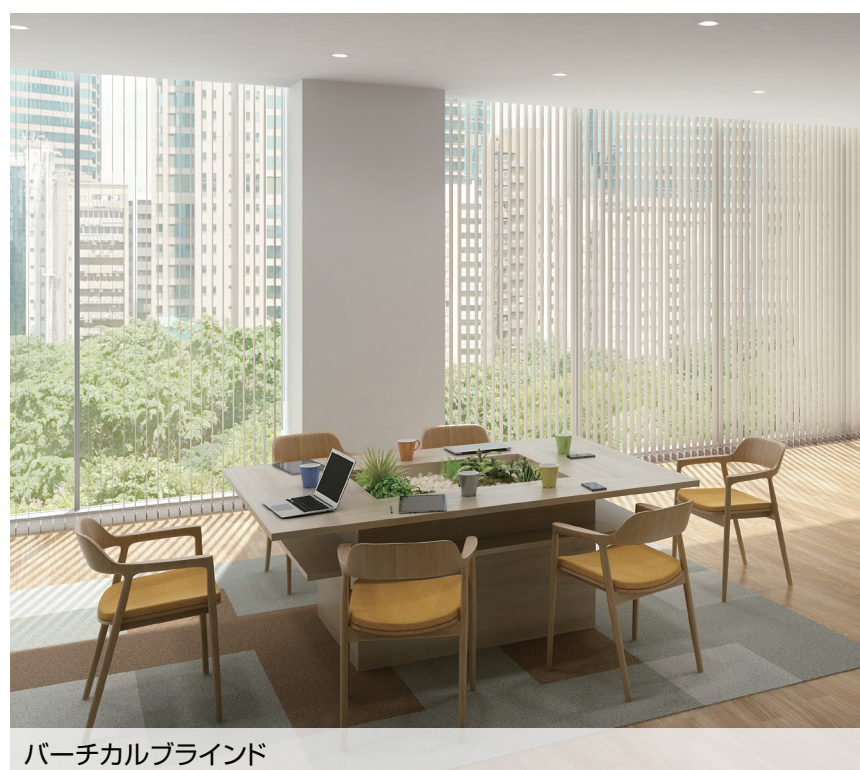
バーチカルブラインド V-1204 グレージュ