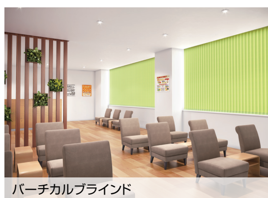
バーチカルブラインド V-1095 フレッシュグリーン