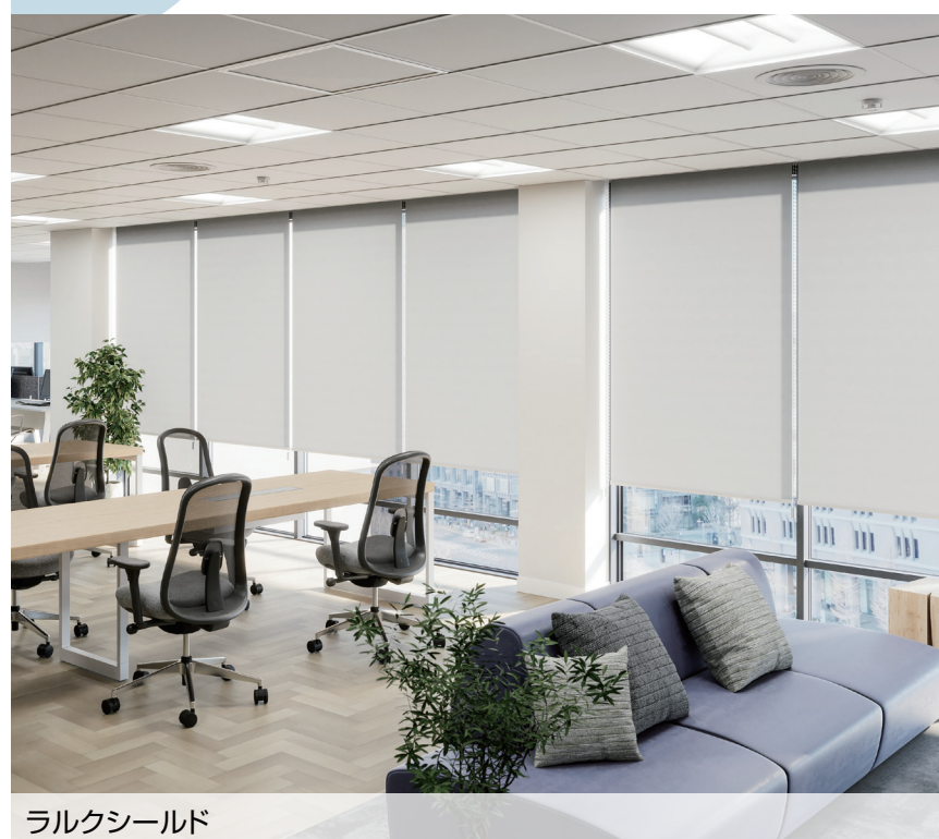
ラルクシールド RS-8863 グレー