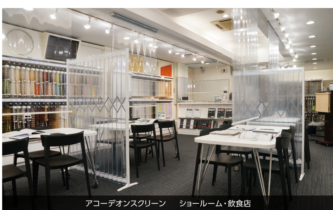
アコーディオンスクリーン ショールーム・飲食店