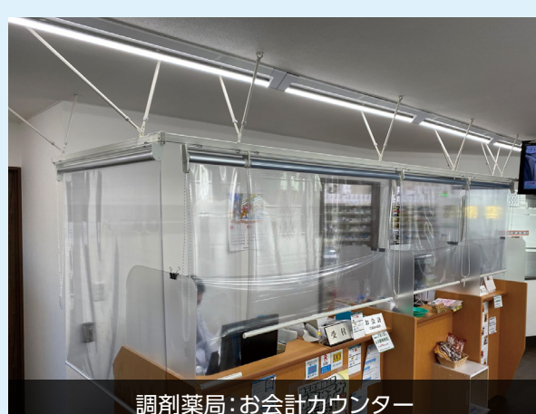
調剤薬局:お会計カウンター