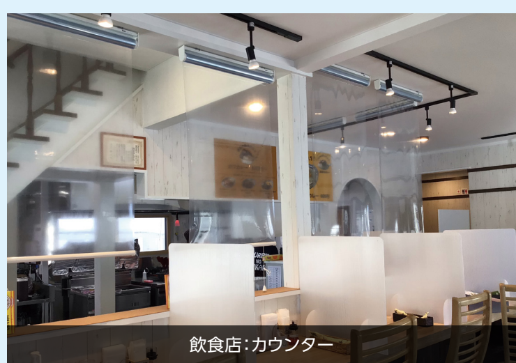
飲食店:カウンター