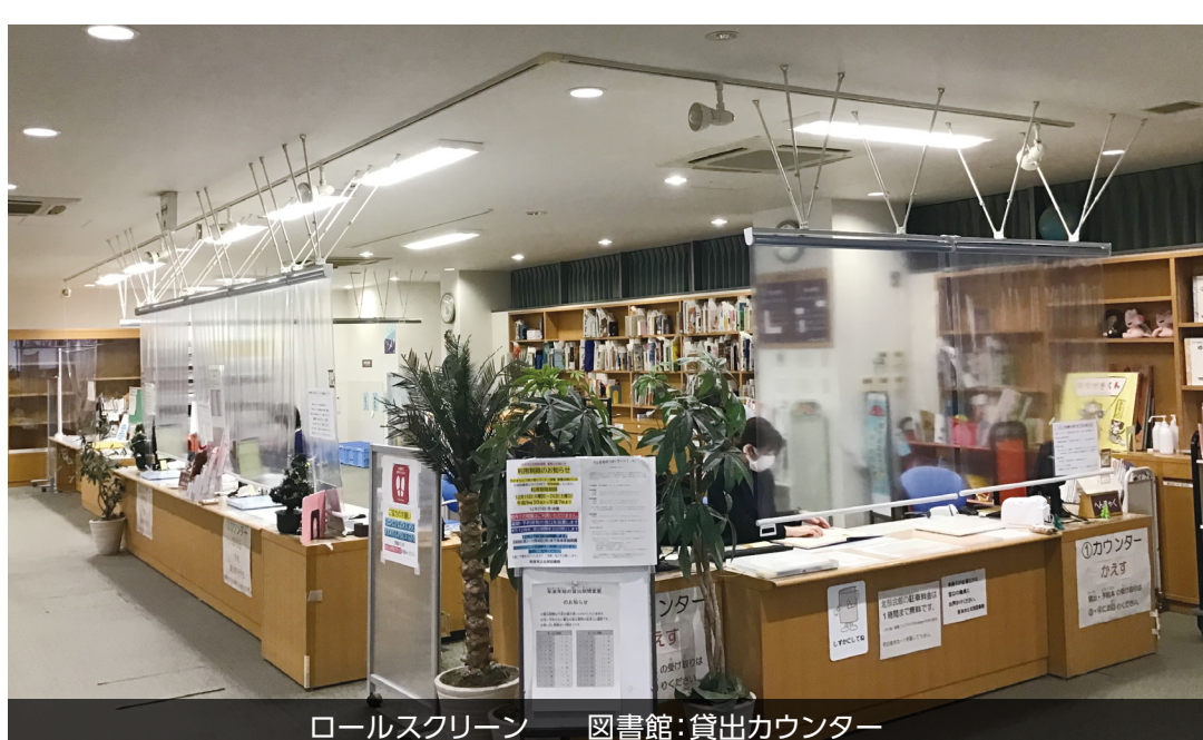
ロールスクリーン 図書館:貸出カウンター

SIAAマークはISO 22196法により評価された結果に基づき、抗菌製品技術協議会ガイドラインで品質管理・情報公開された製品に表示されています。