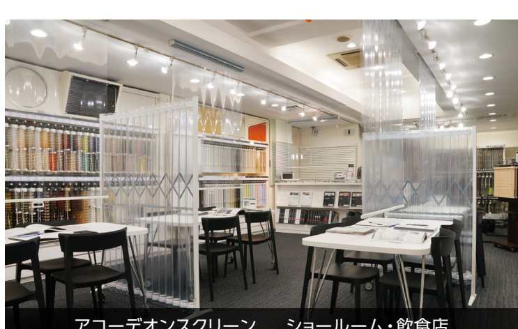
アコーディオンスクリーン ショールーム・飲食店