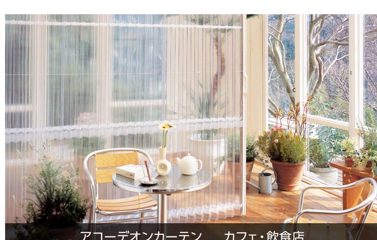
アコーディオンカーテン カフェ・飲食店