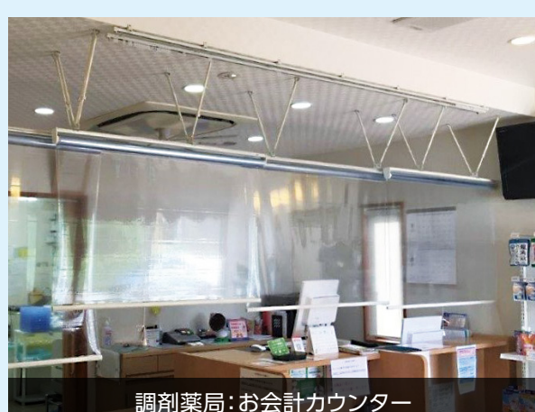
調剤薬局:お会計カウンター