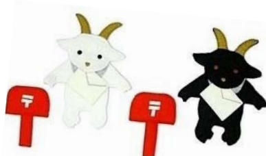
やぎさんゆうびん

ボランティアグループ「TOY工房どんぐり」主宰によるイベントを開催します。約80点の手づくり布おもちゃを展示し、実際に触ったり、投げたり、くっつけたりと、いろんな遊びを体験できます。期間中、歌エプロンなどを使ったイベント「歌とお話」や、人気のおもちゃ「さかなつり」を製作するワークショップも開催します。