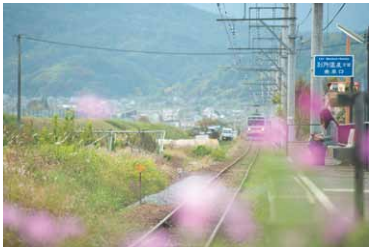
「深まり行く秋」越 信行

その長野県内の281駅をめぐり、約60駅の表情をまとめた写真集「信州 四季の駅旅」に収めた作品を中心に、新作を交えた約40点を展示します。