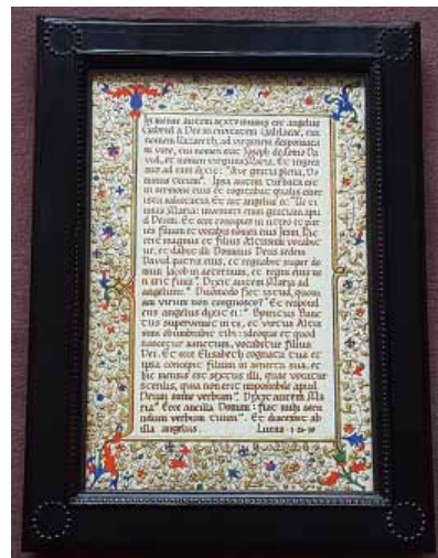
「ラテン語による聖書ルカ伝」