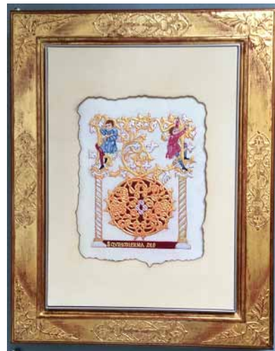
「装飾文字D-木に登る人」