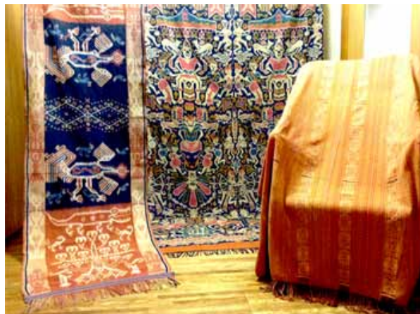
磯部氏が長年収集してきた 希少な布の数々を展示する

継承者の減少などにより、歴史的・文化的価値も高まっている 希少なアジア伝統布に触れ、その魅力をご堪能ください。