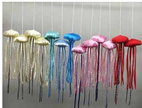
新作の重症児向けおもちゃ「クラゲ」

【ボランティアグループ TOY工房どんぐり】 http://toy-donguri.net