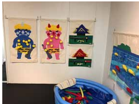
昨年の「春がきた みんなであそぼう布おもちゃ2017」の様子

お子さまの成長の手助けとなるべくデザインされた、あたたかみのある布おもちゃの世界を、是非ご体感ください。