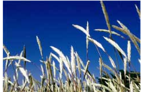
くさのきよみ氏による草たちの写真

きれいな花を咲かすことのない草たちの、美しくやさしい神秘的な世界をお楽しみください。