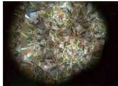
万華鏡に入れた草の姿