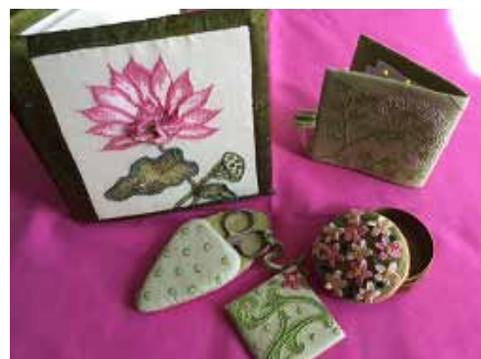
クスノキ アツコ氏が制作した チュールレース刺しゅうの数々を展示

◇展覧会名： イタリアのチュールレース刺しゅう展 ～小さな村の伝統技法と和の心～