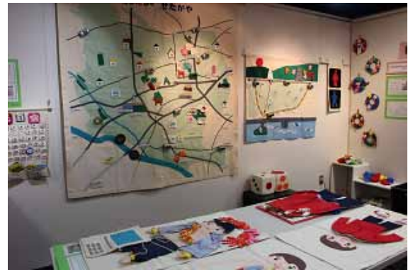
昨年の「春がきた みんなであそぼう布おもちゃ2018」の様子