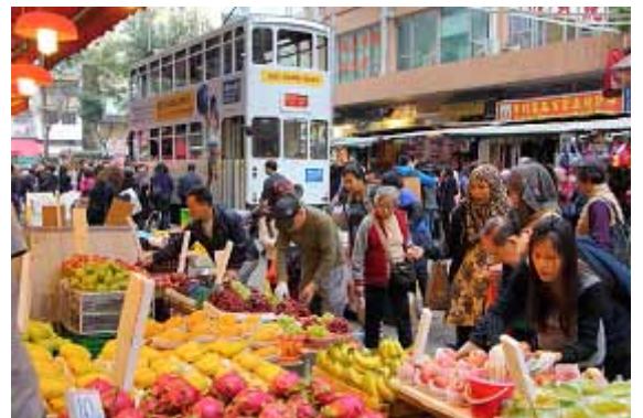
「香港路面電車&lt;トラム&gt;の走る街」展示作品②