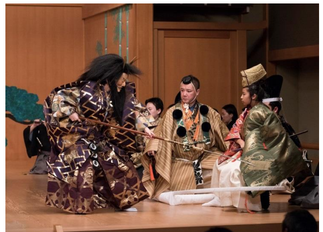
「能楽写真展」展示作品