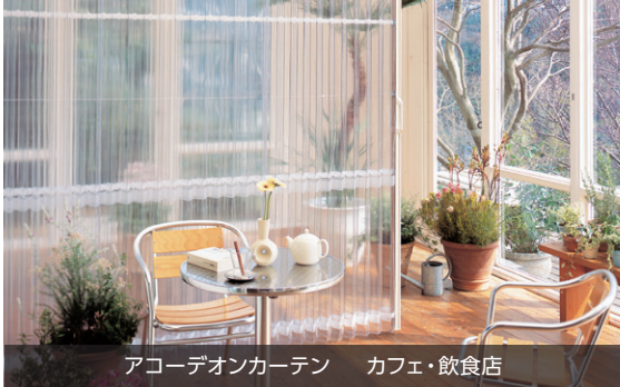
アコーディオンカーテン カフェ・飲食店

手軽に設置できる間仕切として人気の「アコーディオンカーテン」「アコーディオンスクリーン」にも “抗ウイルス・抗菌SIAA マーク” を取得した 透明レザー が新登場！「透明ロールスクリーン」と一緒に使えば、さらに安心・快適です！