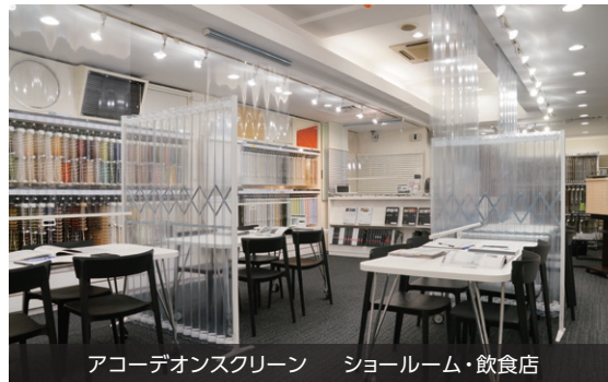
アコーディオンスクリーン ショールーム・飲食店