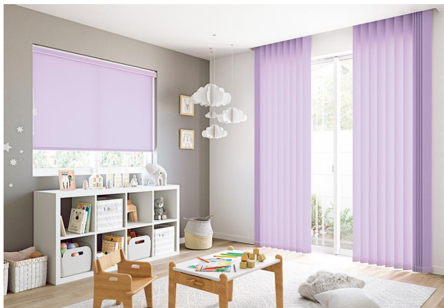
生地：マカロンラテ（ラベンダー） 部品色：オフホワイト [左]ロールスクリーン「ラルクシールド」、[右]タテ型ブラインド「ラインドレープ」

立川ブラインド工業株式会社（本社：東京都港区三田、資本金：44億7,500万円、代表取締役社長：池崎久也）は、ロールスクリーン・タテ型ブラインド向けの生地「マカロン」をリニューアルし、トレンドのインテリアにも合わせやすい上品なラテカラーを加えた新生地「マカロンラテ」を2023年4月3日（月）に発売いたします。