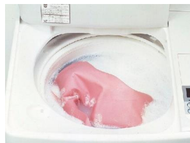
洗濯機で洗うことができます