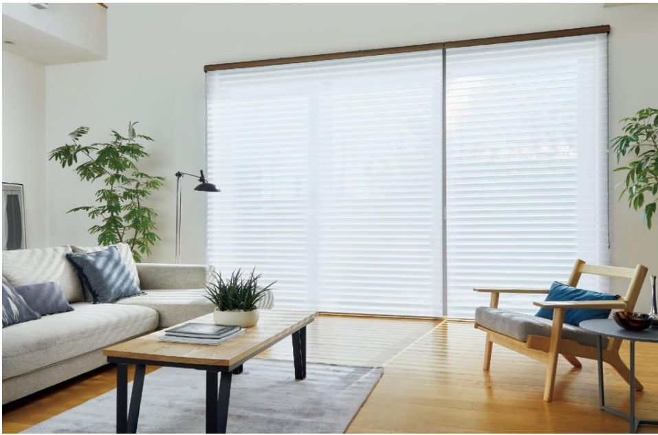
調光ロールスクリーン「ルミエ」 生地：ウェール(ホワイト)

立川ブラインド工業株式会社（本社：東京都港区三田、資本金：44億7,500万円、代表取締役社長：池崎久也）は、ファブリックの美しい意匠性と、採光や眺望を自由にコントロールできる機能性を兼ね備えた調光ロールスクリーン「ルミエ」を2023年7月3日（月）に新発売いたします。