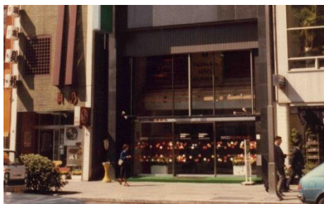
▲1978年 銀座ショールーム