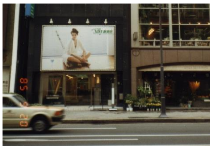
▲1985年 銀座ショールーム