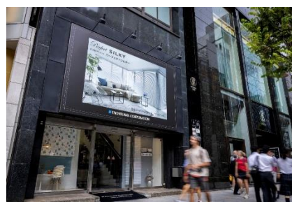
▲2025年 銀座ショールーム