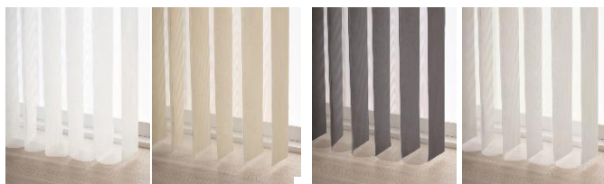
▲AR-706 ホワイト ▲AR-707 グレージュ ▲AR-708 チャコール ▲AR-709 グレー

遮光生地の「マージ遮光」に、新色「グレー」を追加しました。人気の高いグレーを追加することで、モダンなインテリアや落ち着いた空間まで、コーディネート幅を広げます。住宅用途はもちろん、ホテルや商業施設など、さまざまな空間に上質な空気感をもたらすカラーです。