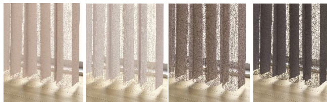
▲AR-715 グレージュ ▲AR-714 グレー ▲AR-716 ブラウン ▲AR-717 チャコール

新たにラインナップに加えた「メーレ」は、糸の織りによって生まれる豊かな表情を特長とする生地です。均一になりすぎないミックス感のある生地が、窓辺に奥行きとやわらかな陰影をもたらし、意匠性を重視した住宅空間にも心地よくなじみます。自然光をやさしく取り入れながら、光の入り方を穏やかに調整できるため、明るさを確保しつつ、落ち着いた雰囲気演出したい住まいに最適な仕様です。