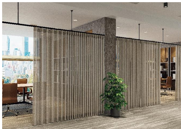
▲間仕切カーテンレール「クロシード」 調光タテ型ブラインド「エアレ」