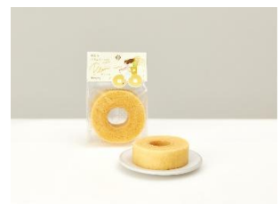
▲Ring Ring バームクーヘン