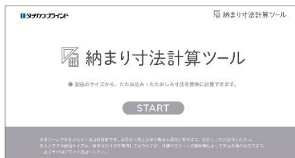
「納まり寸法計算ツール」