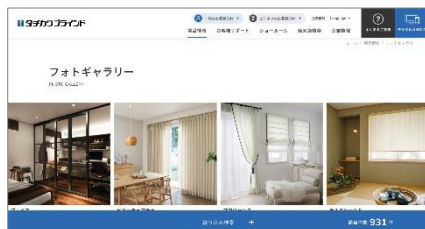
「フォトギャラリー」