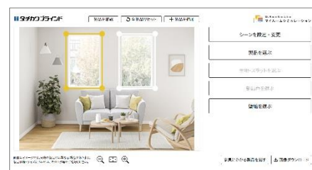
「マイルームシミュレーション」