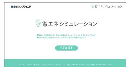
「省エネシミュレーション」

タチカワブラインド ホームページ https://www.blind.co.jp/