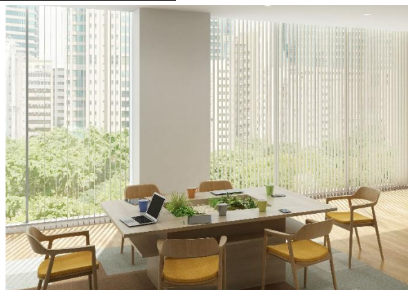
タテ型ブラインド「バーチカルブラインド」 V-1204 ポルテⅡ(グレイージュ)